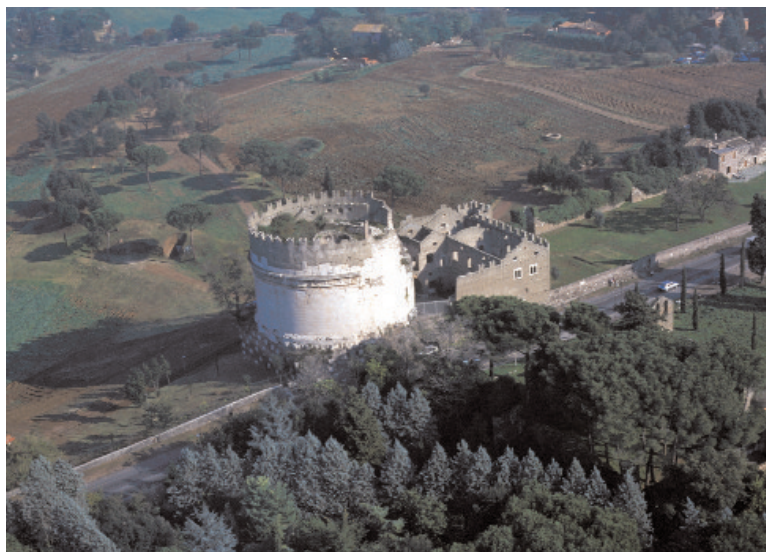
Mausolée de Cecilia Metella, sur la Via Appia